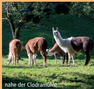
nahe der Clodramühle

Clodra: Ein Ort mit viel Charme, da viele der Häuser mit Liebe zum Detail renoviert wurden. Am Töpferberg befinden sich der naturbelassene Campingplatz und eine Gaststätte. Der Töpferberg ist idealer Ausgangsort für Wanderungen ins mittlere Elstertal. Die Clodramühle mit der Schafshofkäserei liegt mitten im Elstertal. Die Besitzer der Mühle betreiben eine Schafwollverarbeitung und die in der Nachbarschaft gelegene Schafskäserei lädt zum Besuch und Verkostung ein. Von hier aus starten auch Kanutouren auf der Weißen Elster.