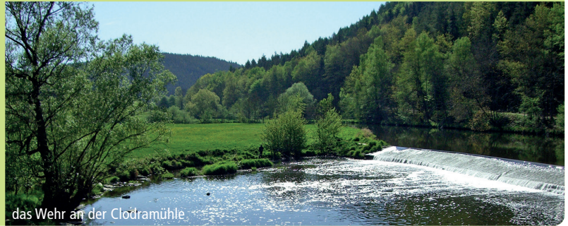
das Wehr an der Clodramühle

Anbindungen an überregionale bzw. regionale Radwege: Elsterradweg, Fernradweg Euregio Egrensis, Hofladenroute