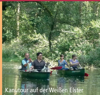
Kanutour auf der Weißen Elster