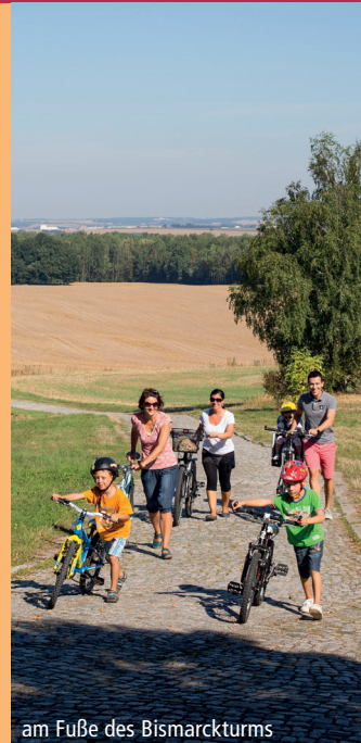
am Fuße des Bismarckturms

Landwirtschaftsbetrieb Klingshirn – Paitzdorfer Straße 2 in Rückers- dorf