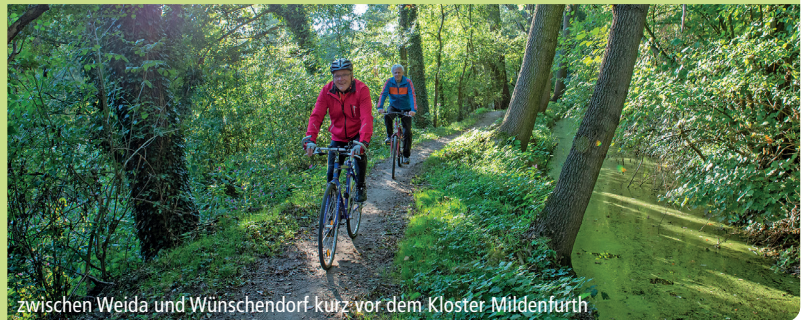
zwischen Weida und Wünschendorf kurz vor dem Kloster Mildenfurth

Fuchsbachtalroute, Rund um Ronneburg, Elsterradweg, Osterburgroute