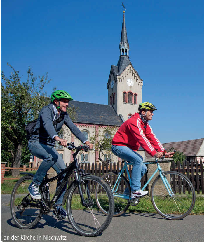
an der Kirche in Nischwitz

Es ist unglaublich wie viele Burgen, Schlösser und Kirchen sich auf dieser Tour durch das thüringische Vogtland befinden. Die Osterburg in Weida wird als „Wiege des Vogtlandes“ bezeichnet. Die Burganlage lädt zur Besichtigung und Besteigung des 54 m hohen Bergfrieds ein. In Wünschendorf treffen Sie auf das älteste Gotteshaus im Vogtland, die Veitskirche, und in Blankenhain erleben Sie die einzigartige Anlage des Deutschen Landwirtschaftsmuseums Schloss Blankenhain. Die Tour führt über Straßen und Feldwege, ausgebaute Radwege, durch eine sanfte Hügellandschaft.