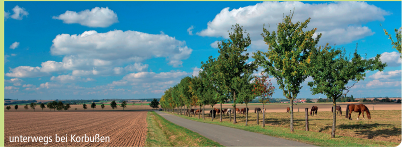
unterwegs bei Korbußen

Bauerngartenroute 2, Bergbauroute, Hofladenroute, Thüringer Städtekette, Burgenroute, Fuchsbachtalroute