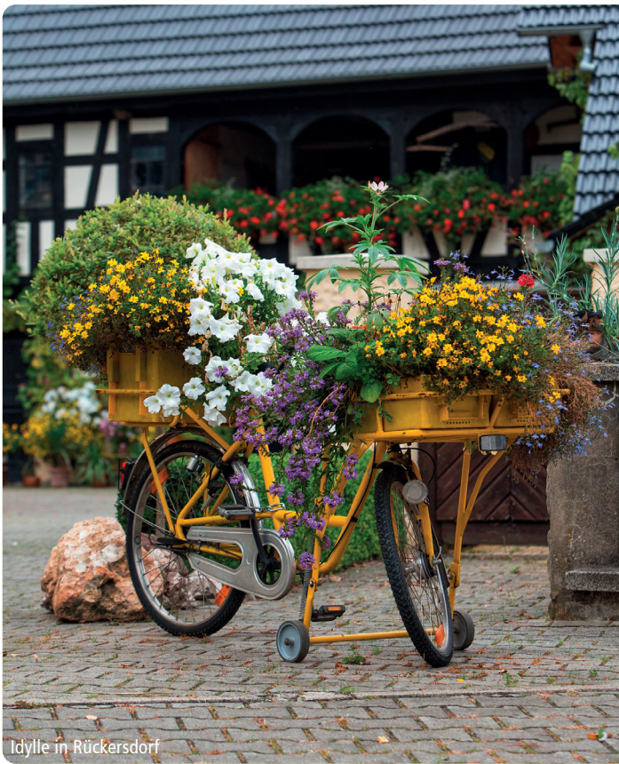
Idylle in Rückersdorf