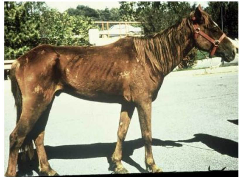
An infektiöser Blutarmut der Einhufer chronisch erkranktes Pferd