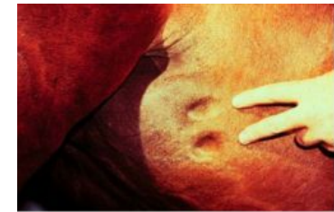
Schwellungen am Bauch (Oedema)