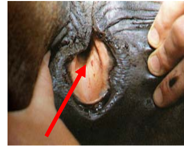
Petechiale Blutungen in den Schleimhäuten

Tiere, die symptomlos erkranken und damit gesund erscheinen, sind lebenslang Träger des Virus und stellen eine ständige Ansteckungsgefahr für andere Equiden dar.